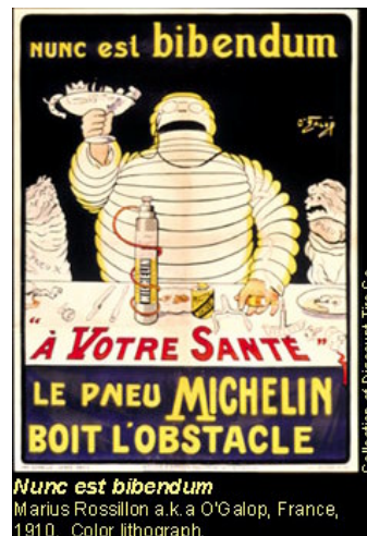
Nunc est bibendum Marius Rossillon a.k.a. O'Galop, France, 1910. Color lithograph.