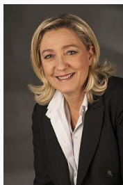
Marine Le Pen (2014)