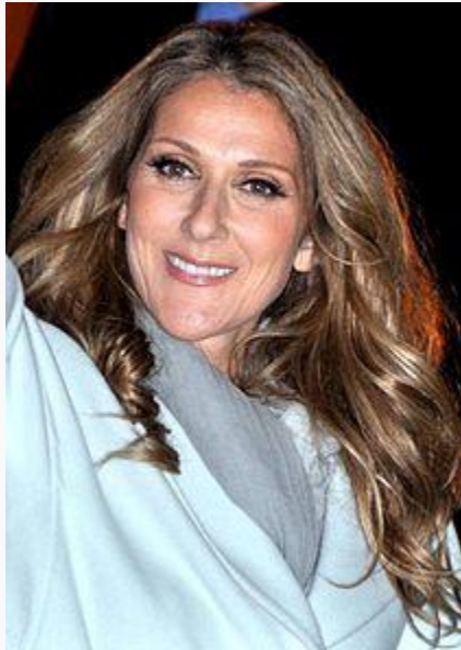
Céline Dion i november 2012.