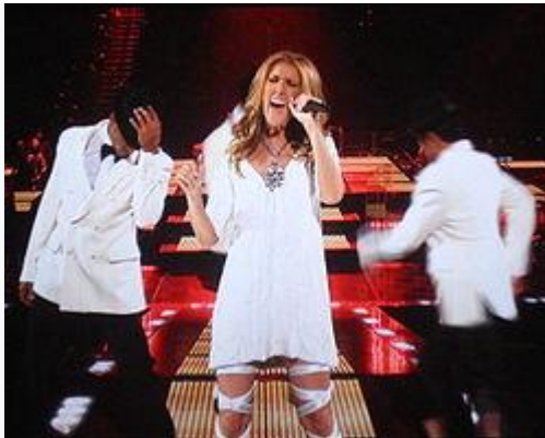
Dion under sin Taking Chances Tour 2008

Hennes album Taking Chances , som kom ut i mitten av november 2007, har redan sålt guld i Sverige (över 30 000 skivor) och har legat som bäst på en 8:e plats på den svenska albumlistan (vecka 47 2007).