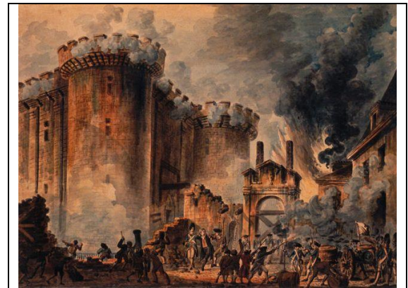
Prise de la Bastille le 14 juillet 1789