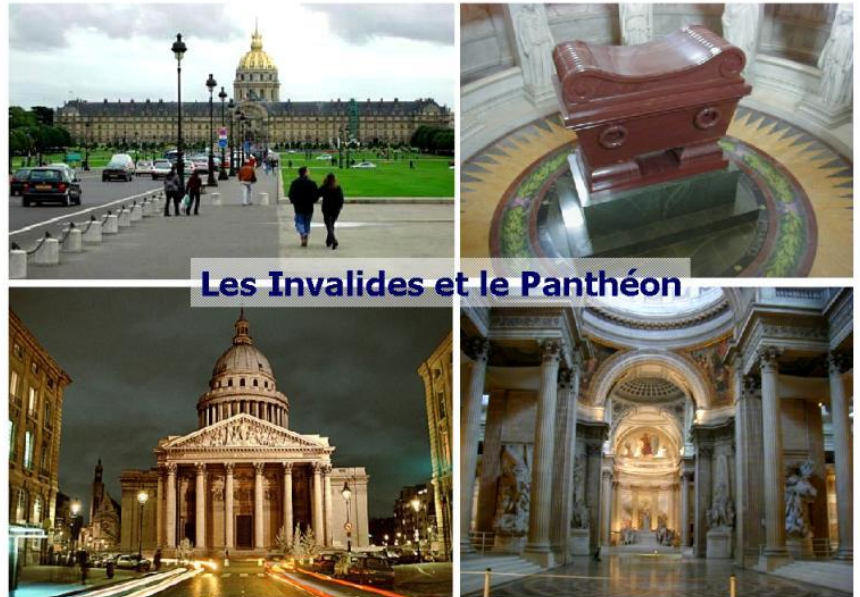
Les Invalides et le Panthéon