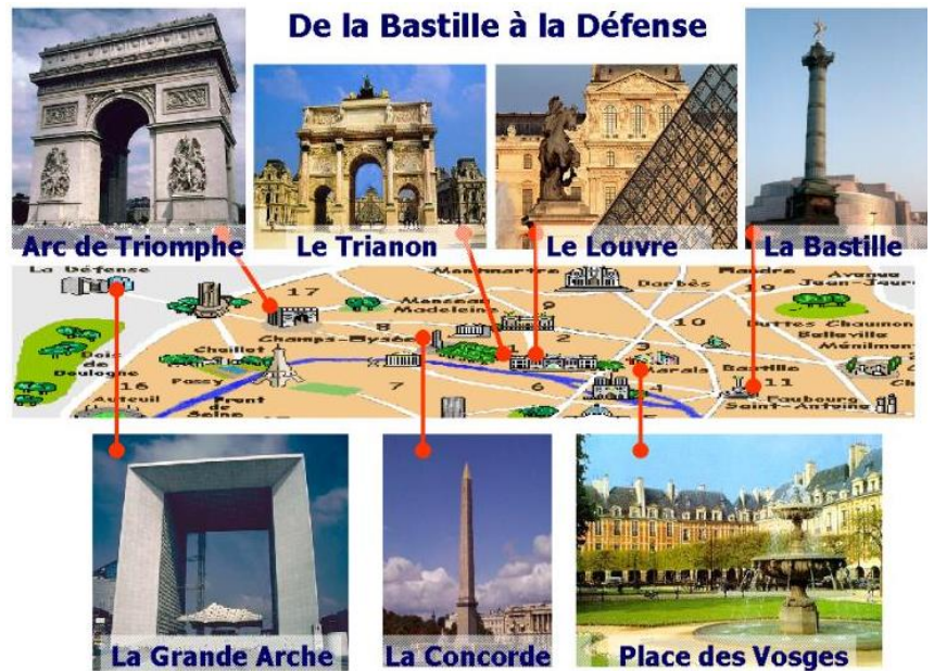
De la Bastille à la Défense