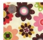
Fleuri À fleurs