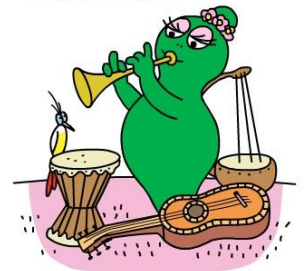
elle joue de la flûte

Barbalala aime la musique. Elle joue de tous les instruments. Elle aime aussi la botanique et l'écologie, comme Barbidou. Elle est très calme et très gentille.