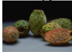
Une figue de Barbarie