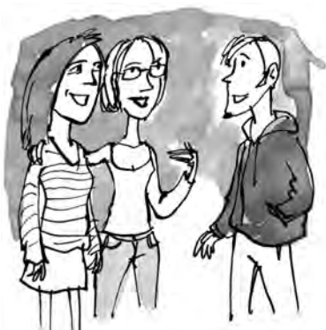
Situation n° 0