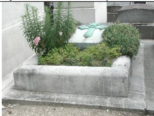
sa tombe au Père-Lachaise