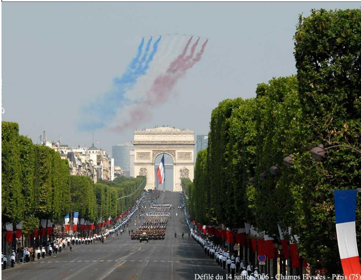
Défilé du 14 juillet 2006 - Champs Elysées - Paris (75)