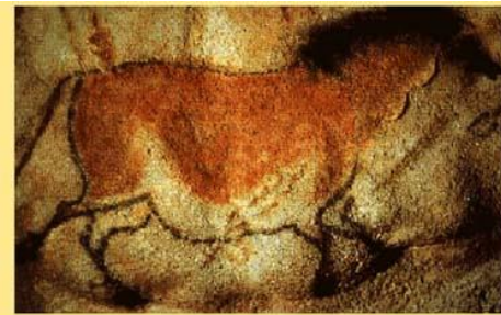
Grottes de Lascaux