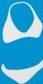
Maillot 2 pièces