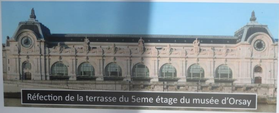
Réfection de la terrasse du 5eme étage du musée d'Orsay

sortie de secours prière de ne pas encombrer