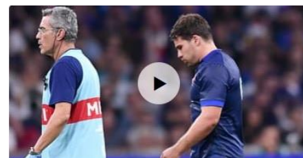
XV de France: Antoine Dupont a été opéré, le compte à rebours a démarré