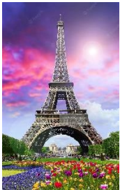
la Tour Eiffel (la toor äffäll)