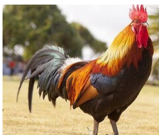
UN COQ (ööö kâck schaa)