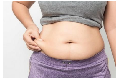
le ventre (lö