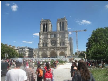
le Notre Dame (lö nâtrö damm)