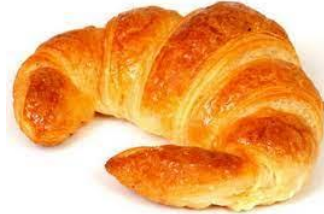
le croissant (le kråassaaa schaa)