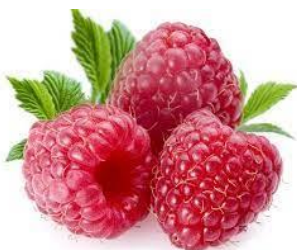
les framboises (lee fraaaambâaz)