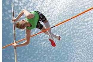
le saut à la perche