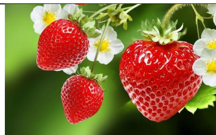
les fraises (lee frääz)