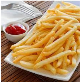
les frites (lee fritt)