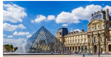
le Louvre (lee loovrö) un grand musée (ööö graaa myzee)