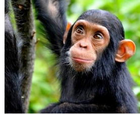
les singes (lee säää(n)sch)