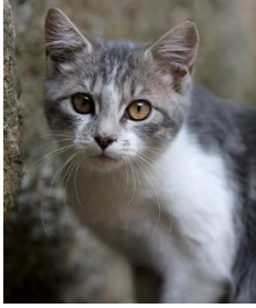
les chats (lee schaa)