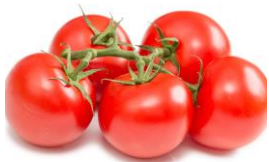
les tomates (lee tämmatt)