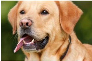
les chiens (lee schiäää)