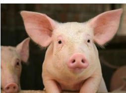
un cochon (ööö kâschää)