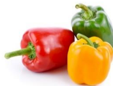
des poivrons (dee påavråää)