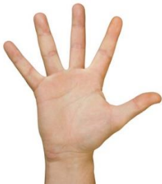
la main (la määä)