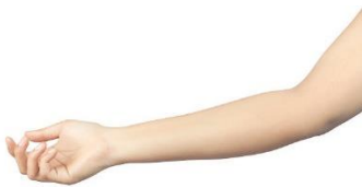
le bras (lö bra)