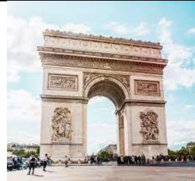
l'Arc de Triomphe (lark dö triääämf)