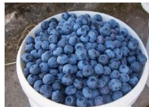
les myrtilles (lee mirrtijj)