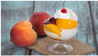
la Pêche Melba (la päsç mällba)