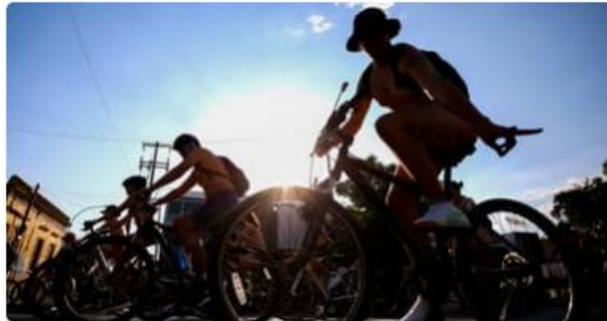
Lyon: la course de cyclisme naturiste aura bien lieu mais avec un parcours modifié