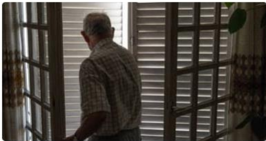
Canicule: des températures encore élevées cette nuit

1 det har varit höga temperaturer i Frankrike i helgen