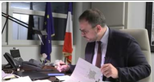
Canicule: malgré la crise des urgences, le ministre de la Santé assure que "l'hôpital fera face"

1 Sverige kommer att stå emot terroristerna