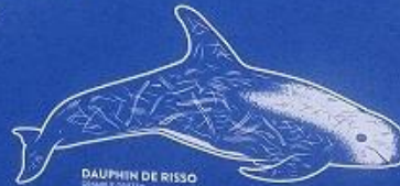
DAUPHIN DE RISSO Stenella risso 2,10 mètre 8 à 100 kg