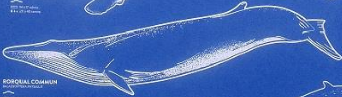
RORQUAL COMMUN MEGALOPHTHA COMMUNIS jusqu'à 30 mètres jusqu'à 40 tonnes