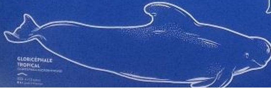
GLORICÉPHALE TROPICAL Halargyreus tropicalis 1,10 mètre 8 à 100 kg