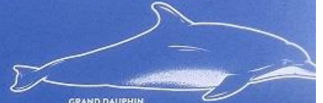
GRAND DAUPHIN Lipotes vexillifer 3,20 mètre 8 à 200 kg