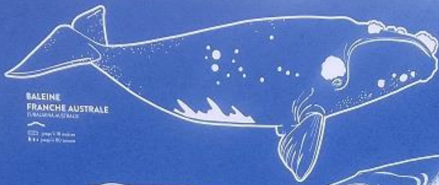
BALEINE FRANCHE AUSTRALE EUBALAENA AUSTRALIS jusqu'à 30 mètres jusqu'à 40 tonnes