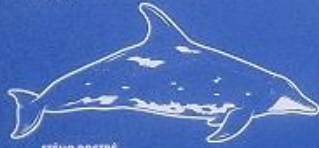
STENO ROSTRÉ Steno bredanensis 1,90 mètre 8 à 100 kg