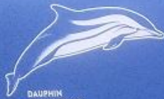
DAUPHIN BLEU ET BLANC Steno bredanensis 1,90 mètre 8 à 100 kg