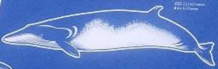
PETIT RORQUAL DE L'ANTARCTIQUE MEGALOPHTHA AUSTROPTERUS jusqu'à 12 mètres jusqu'à 10 tonnes