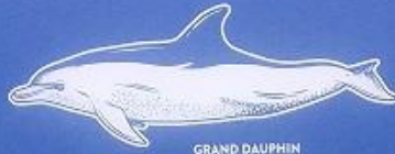
GRAND DAUPHIN DE L'INDO-PACIFIQUE Lipotes vexillifer 3,20 mètre 8 à 200 kg