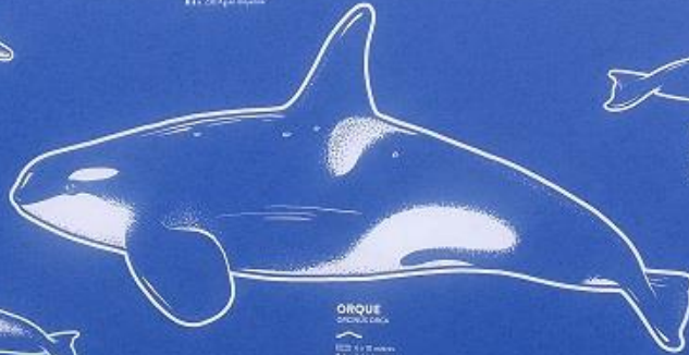
ORQUE Orcinus orca 3,10 mètre 8 à 100 kg