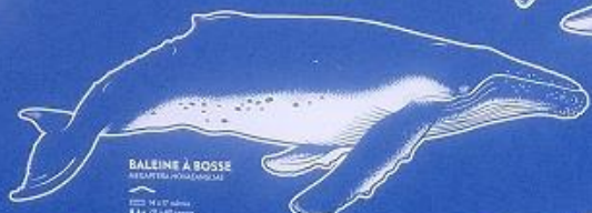
BALEINE À BOSSE MEGALOPHTHA PELOIDEA jusqu'à 24 mètres jusqu'à 30 tonnes