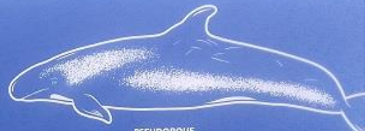
PSEUDORQUE Pseudorca crassidens 3,5 à 4 mètre 8 à 100 kg