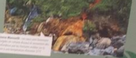
Source Manouilh : un site qui a été découvert par un porteur de sacs pendant le commerce des marbais entre Salazie et Cabanis au début du 20 ème siècle. C'est un site qui a été découvert par un porteur de sacs pendant le commerce des marbais entre Salazie et Cabanis au début du 20 ème siècle.